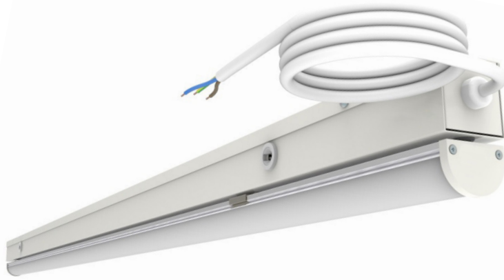
Aansluitsnoer 2000 mm GST18i3 man

Energieklasse A++ (EIA regeling). Levensduur >60.000 branduren (L80/B10). 5 jaar garantie. IP40. Standaard RAL 9010.